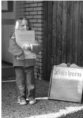
Marie hat auch etwas für sich entdeckt