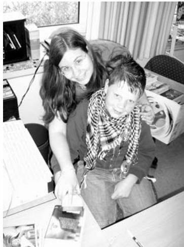
Einscannen macht Spaß